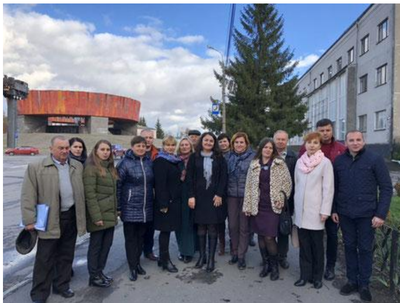
Учасники обласного семінару для спеціалістів, відповідальних за роботу музеїв

Учнівський актив нашого Музею історії школи демонструє наявність соціальної та громадянської компетентностей, що проявилось у підтримці корисних ініціатив, зокрема участі у громадських проектах. Серед останніх - проект «Історія моєї громади: Минуле для спільного майбутнього», який реалізується представництвом DVV International в Україні у партнерстві з Фондом Кьорбера та у співпраці з Всеукраїнською асоціацією викладачів історії та суспільних дисциплін “Нова Доба”, міжнародною мережею історичних конкурсів EUSTORY за підтримки Міністерства закордонних справ Німеччини.